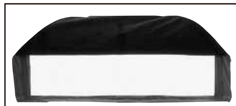
プロストリップバンク SSシルバー